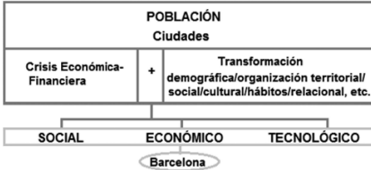
FIGURA: Áreas de Investigación (Elaboración propia, 2020)

Teniendo presente los tres bloques temáticos presentados anteriormente, se han elaborado una serie de cuestiones, las cuales se pueden visualizar en el cuadro 2, que se pretenden resolver con el análisis.